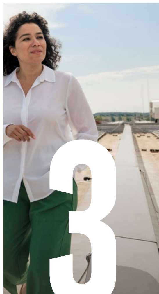
Duurzame transitie van bedrijven